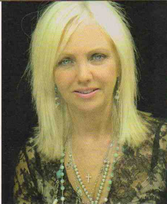
Rhonda Byrne: "Alles wat je écht wilt, krijg je ook."

meest egocentrische soort. Het Geheim wordt omschreven als een natuurwet, onpartijdig en onverschillig. Het maakt niet uit wát je vraagt. Voor moraal is dus geen enkele plaats, zorg voor anderen is van ondergeschikt belang, aan de consequenties van jouw geluk voor andere mensen of de leefomgeving worden geen woorden vuil gemaakt. Ondanks het feit dat er veel feel-good -retoriek gebruikt wordt die The Secret een positivistisch tintje moet geven, is Het Geheim dus ten diepste nihilistisch: er bestaat in deze 'geheime leer' geen moraal, geen liefde, geen hoger goed, geen genade, geen God.